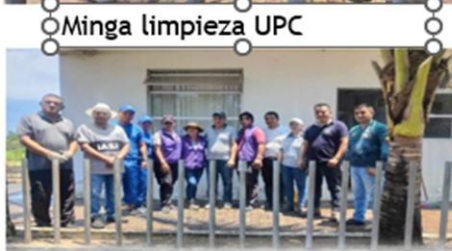
Minga limpieza UPC